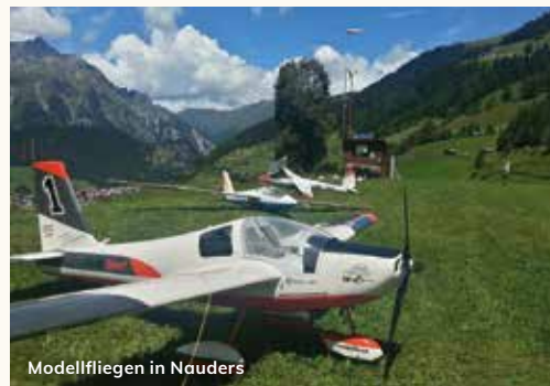
Modellfliegen in Nauders