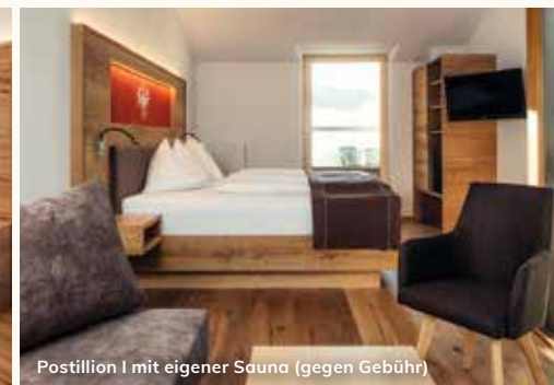
Postillion I mit eigener Sauna (gegen Gebühr)

2 getrennte Schlafräume mit Stockbetten oder Doppelbett, 2 Etagen, Dachterrasse