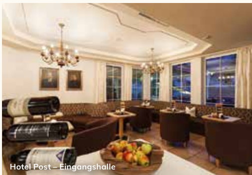
Hotel Post – Eingangshalle